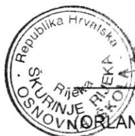
ORLANDO BALIČEVIĆ, RAVNATELJ)

Zapisnikom se utvrđuje da predstavnici proračunskog korisnika OŠ Škurinje preuzimaju rashodovanju imovinu kako slijedi: