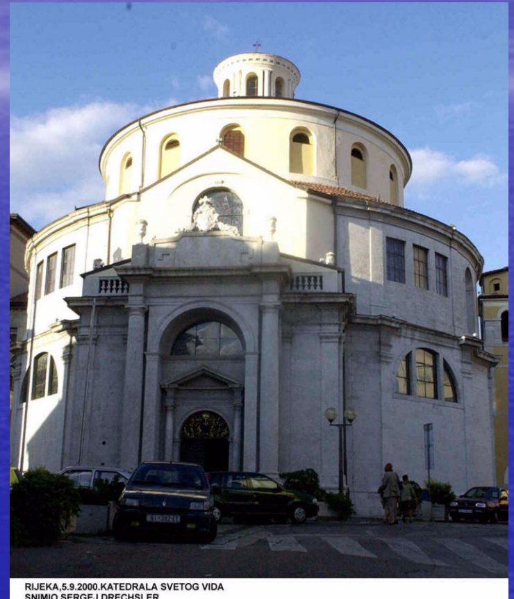
RIJEKA, 5. 9. 2000. KATEDRALA SVETOG VIDA